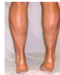
3. Op tenen gaan staan