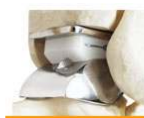
Figuur 2: de enkelprothese

De enkel is het gewricht tussen het onderbeen en de voet. De gewrichten zijn bedekt met een laagje kraakbeen, de 'schok- en smeerlaag' van het gewricht. Het kraakbeen zorgt ervoor dat het gewricht soepel is en dat schokken tijdens het lopen worden opgevangen. Als het kraakbeen slijt of in kwaliteit achteruit gaat, noemen we dit artrose. Artrose gaat vaak gepaard met (ernstige) pijnklachten. Het plaatsen van een enkelprothese kan dan een goede oplossing zijn.