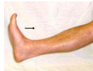
1. Voet optrekken