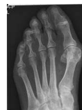
Voor de operatie

De operatie duurt ongeveer 45 tot 70 minuten.