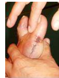
U beweegt uw teen omlaag/van u af