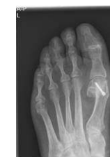
Na de operatie