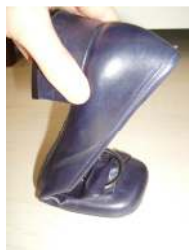
geen goede, te buigzame zool

Als uw eigen schoen of een gewone schoen uit de winkel niet meer past door de breedte van uw voet of door klauwtenen, zijn (deels) op maat gemaakte schoenen wellicht iets voor u.