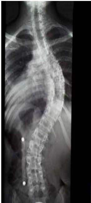
Röntgenfoto van scoliose voor operatie

Op de röntgenfoto's kun je zien hoe de wervelkolom er voor en na de operatie uit ziet.