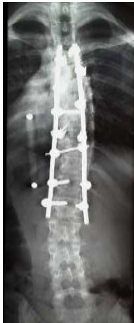
Röntgenfoto van dezelfde scoliose na de operatie