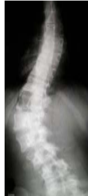
Röntgenfoto van scoliose voor operatie

Voor meisjes geldt dat in de toekomst een zwangerschap gewoon mogelijk is.