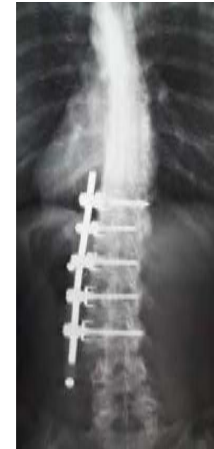
Röntgenfoto van dezelfde scoliose na de operatie (via borstkas)

Als de operatie klaar is, legt de chirurg soms nog een slangetje (een wonddrain) in de wond. Dit slangetje voert het wondvocht af. Het wondvocht komt dan in een opvangpot. Als de operatie via de voorkant/zijkant wordt gedaan, dan opent de chirurg de borstkas. Hierbij klapt één long tijdelijk in. Als de borstkas na de operatie weer dichtgehecht is, krijgt de long zijn normale vorm terug. Om de long hierbij een beetje te helpen, gebruiken we een zuigslang (thoraxdrain). Die komt in de borstkas. Deze zuigslang blijft minstens 2 dagen zitten.