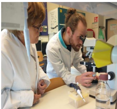
2 (links) STAP Patiënt en onderzoeker op het Laboratorium Experimentele reumatologie van het Radboudumc